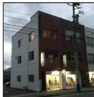
第二教室 訓練施設外観