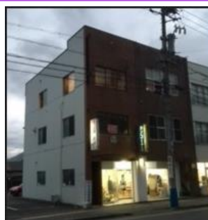
第二教室 訓練施設外観