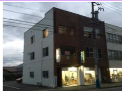
第二教室 訓練施設外観