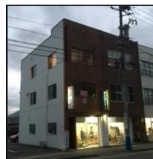
第二教室 訓練施設外観